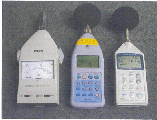
●講演内容2-騒音計、測定、実音経験