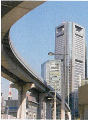
●講演内容1-騒音の測定