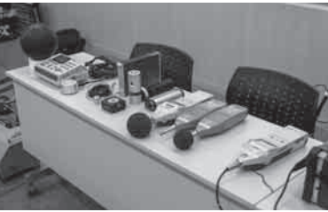
写真4 講習で紹介された計測機器-1