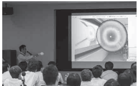
写真2 アコースティックカメラのデモ