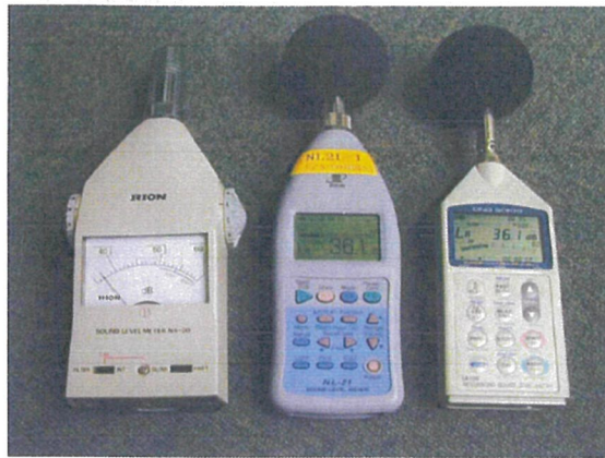
●講演内容1－騒音計、測定、実音経験