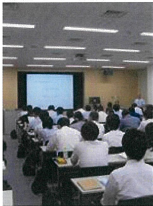
●基礎講習会会場風景