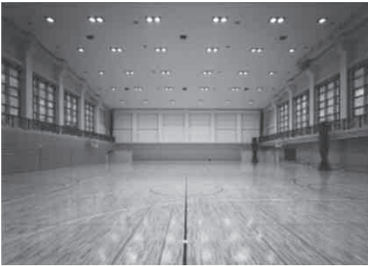
図5 施工写真(2001年竣工当時)