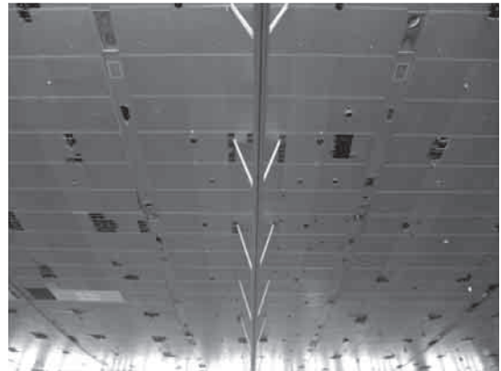
図3 被災後(天井落下)

グランメッセ熊本は中央部が低い逆アーチ状の天井となっていました。天井に耐震補強を施していましたが熊本地震被災時に天井が落下してしまい避難所とし