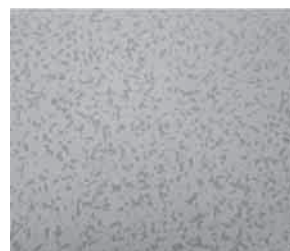
図1 HLPF40 K 25 mm 表面仕上げ

不燃性 無機系の塗料を使用し不燃認定(NM-8610)を取得しているため、防火による内装制限の制約はありません。