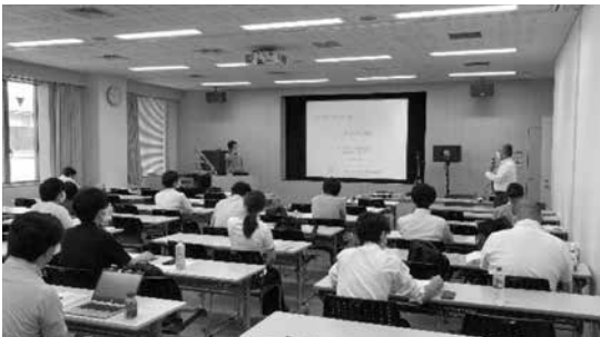
<写真 講習会オープニング>

各テーマの中で参考文献として「音響技術」のバックナンバーが多く紹介されておりました。更に知識を深めたい方は、「音響技術」から学んでみるのはいかがでしょうか。日本音響材料協会では過去の「音響技術」のDVDやバックナンバーの販売をしておりますので、是非、日本音響材料協会ホームページをご覧ください。