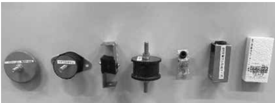
〈写真 防振・制振材料〉

振動に起因した固体伝搬音による騒音が問題になる事があります。振動の基礎知識から振動防止の方法に