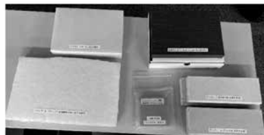
<写真 音響材料サンプル>